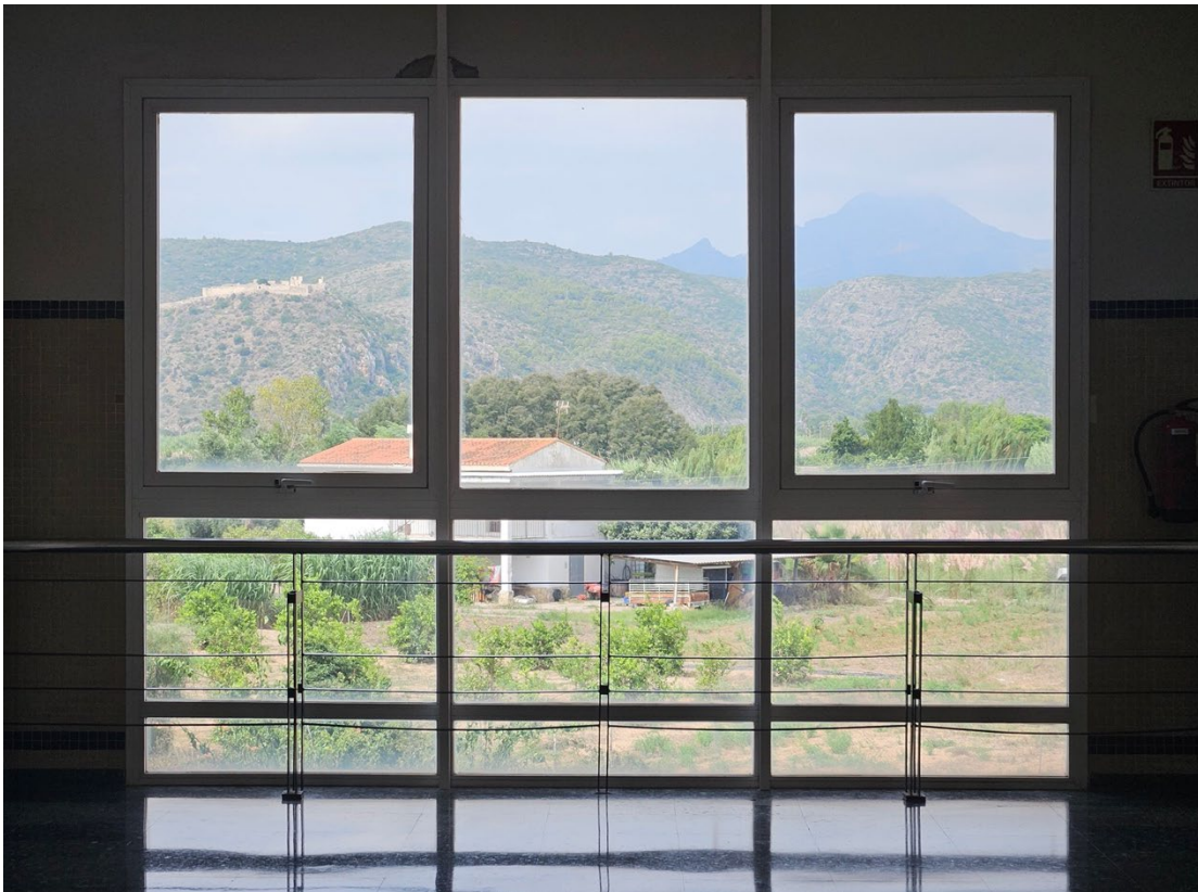
Aussicht von der Uni aus