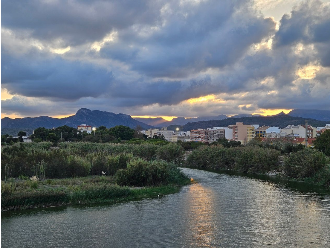
Sonnenuntergang über Gandia