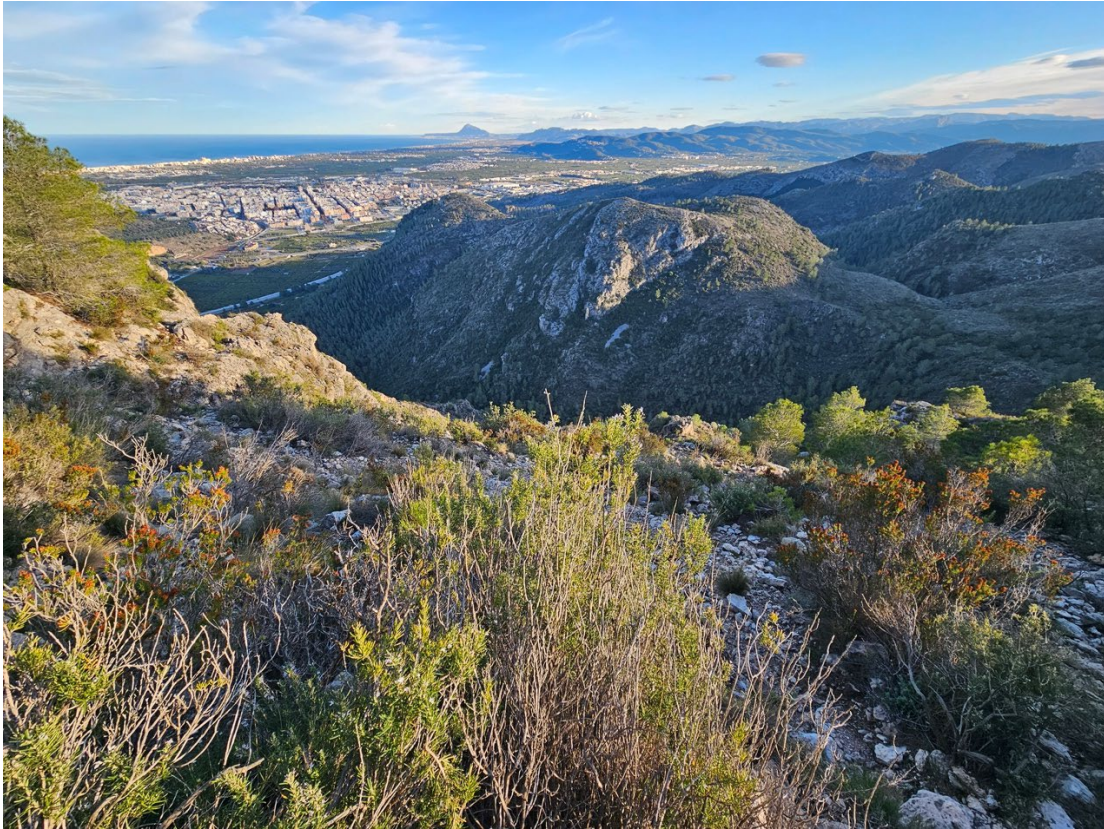
Wandern in den Bergen hinter Gandia