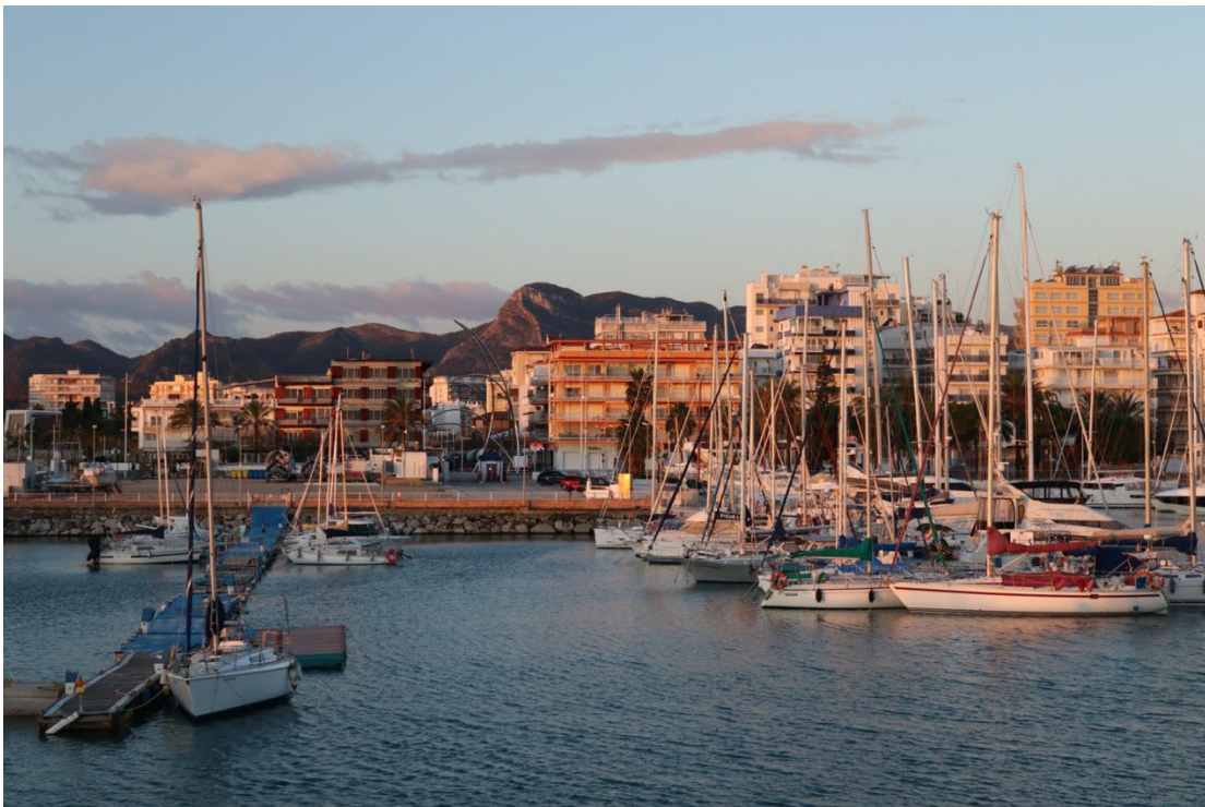
Sonnenaufgang am Hafen von Gandia